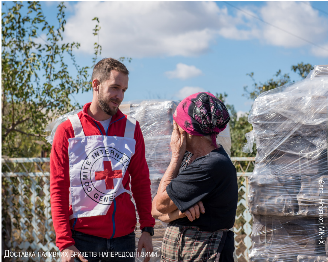
ДОСТАВКА ПАЛИВНИХ БРИКЕТІВ НАПЕРЕДОНІ ЗИМИ.